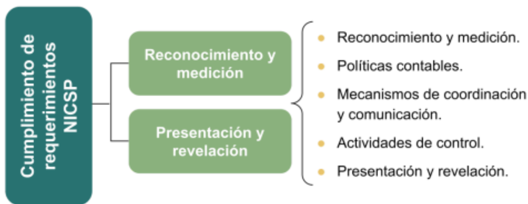
Figura n.º 1 Componentes del área de examen

La verificación de los aspectos esenciales de las normas detalladas de previo se abordó desde las subáreas de reconocimiento y medición, así como la de presentación y revelación, y diferentes temáticas de abordaje; tal como se presenta en la Figura n.º1: