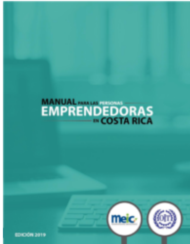
Manual Emprendedor – MEIC 2019