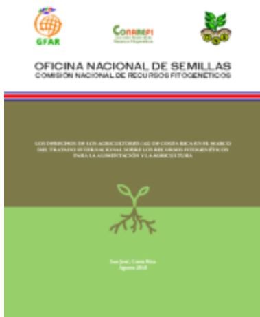
Derechos de los Agricultores en CR, en el marco del