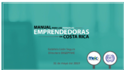
Present. Manual Emprendedores – MEIC 2019